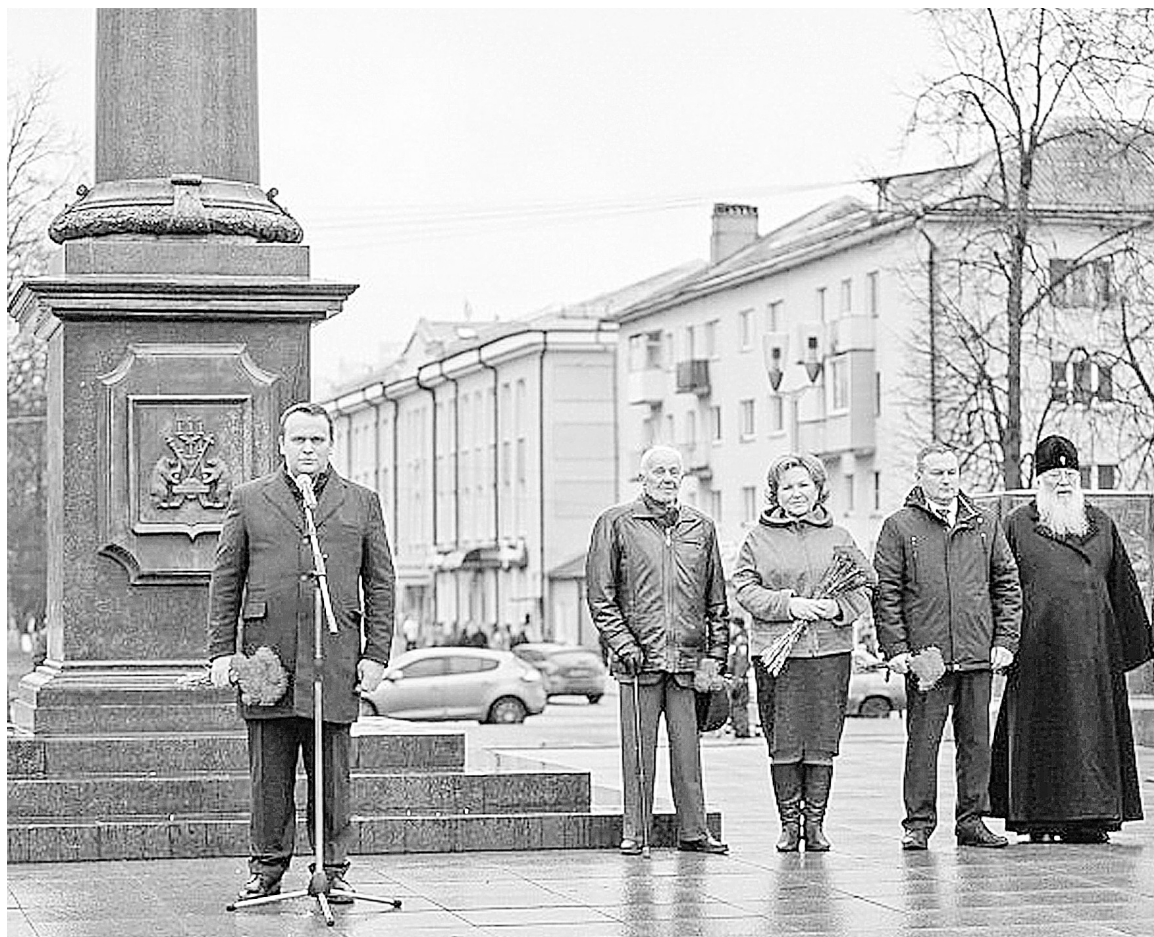
Андрей Никитин на митинге, посвященном 76-й годовщине освобождения Новгорода

Юбилейные награды получили ветераны и участники Великой Отечественной войны, труженики тыла, узники концлагерей и люди, работавшие на временно оккупированных территориях СССР.