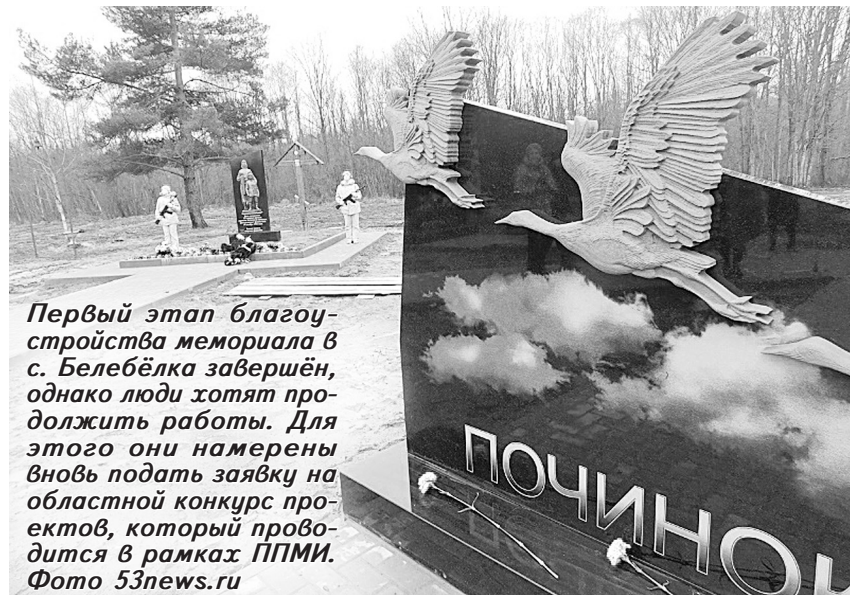
Первый этап благоустройства мемориала в с. Белебёлка завершён, однако люди хотят продолжить работы. Для этого они намерены вновь подать заявку на областной конкурс проектов, который проводится в рамках ППМИ.

Также в Новгородской области в рамках проектов гражданских инициатив в этом году будет продолжена работа и по таким проектам, как «Дорога к дому» и «Территориальное общественное самоуправление».