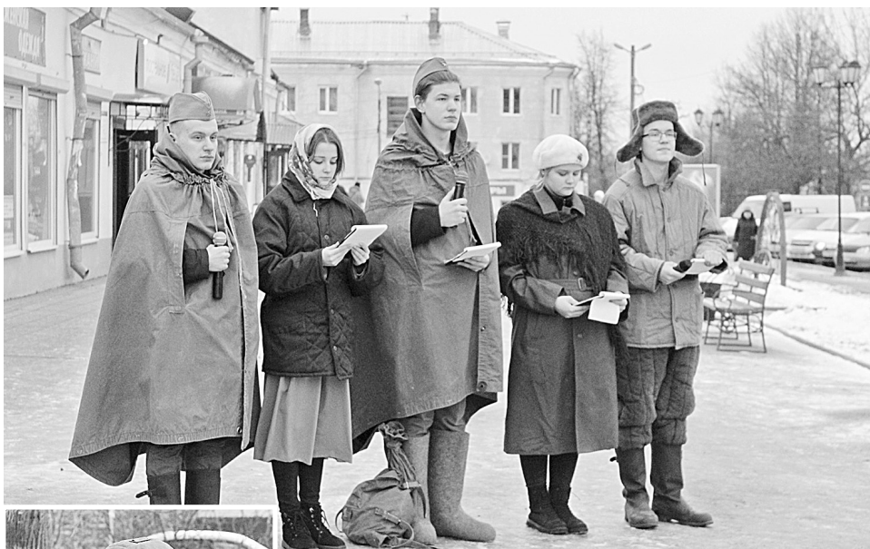
Акцию проводят волонтеры Победы; этот мальчик теперь знает, что такое «блокадный хлеб»